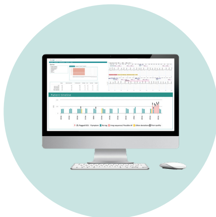
Läkarsystemet Zenicor View